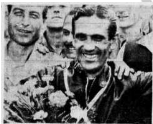
Dario Ambrosini dopo l'arrivo vittorioso nella corsa della 250 cmc. al Gran Premio delle Nazioni. Il fenomenale corridore è riuscito a decimare il campo avversario ed a portare all'ultimo traguardo del campionato mondiale la bandiera della gloriosa Casa pesarese. Il trionfo del binomio Ambrosini-Benelli conferma ancora una volta il valore del pilota e l'eccellenza del mezzo meccanico.